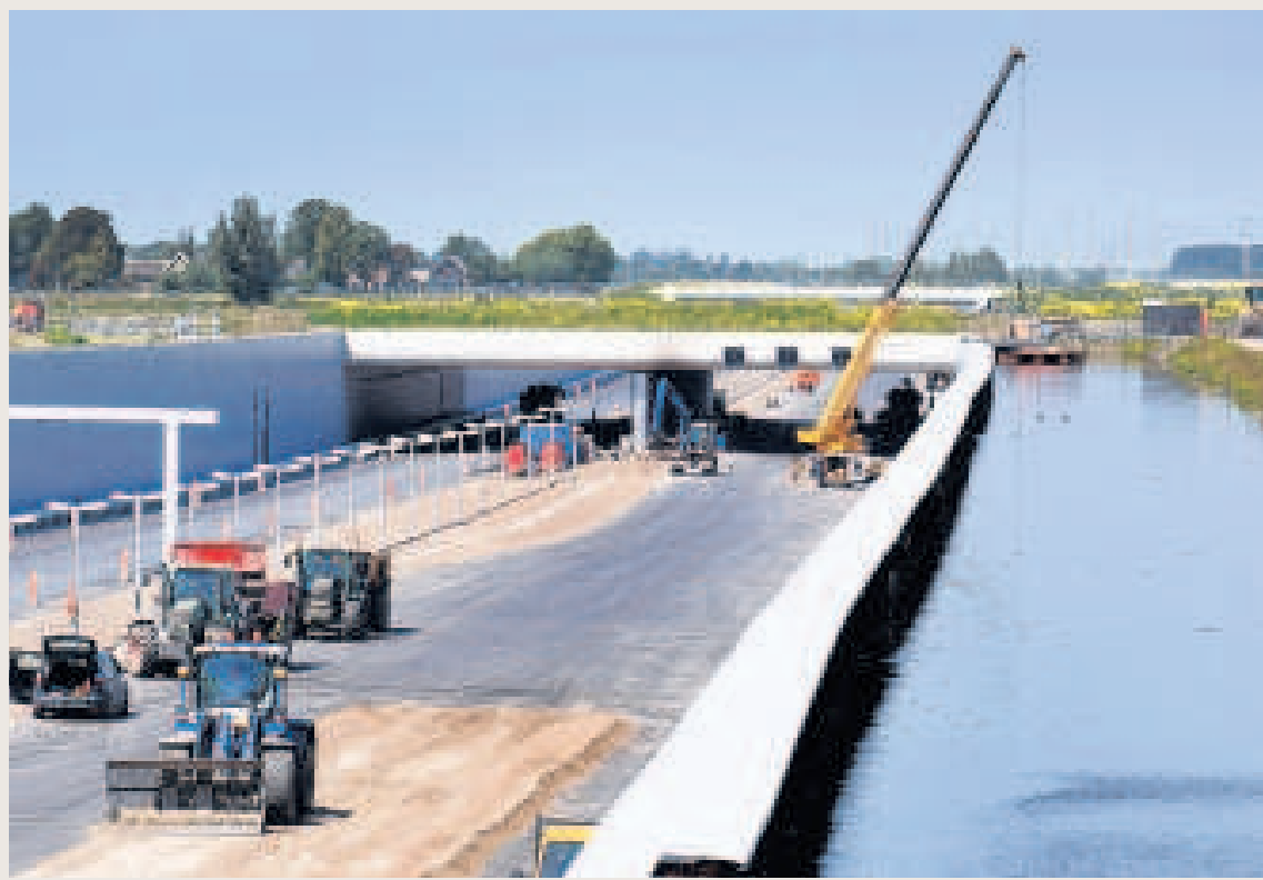
▲ Het eco-aqueduct over de A4 bij Schiedam wordt morgen geopend.