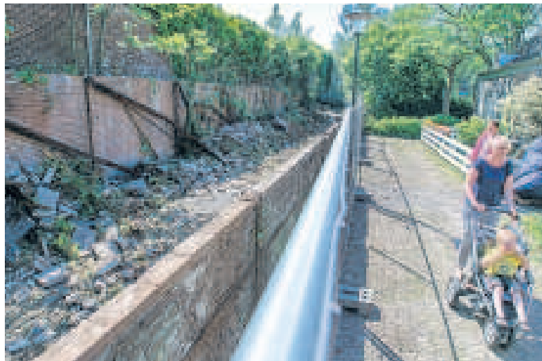
▲ Het ingestorte deel van de Touwbaan aan de Steenplaats.