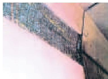
▲ De scheuren in de betonwand van de A4.

„De gemeente heeft de schade niet zelf kunnen opnemen,” stelt Witjes. „Het herstelplan werd pas ingediend toen de reparatie al klaar was. De gemeente heeft daarmee haar