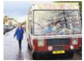
▲ De voormalige SRV-wagen rijdt onder meer in Nieuw Terbregge.

Van het oorspronkelijke plan van Hallatu en Van den Aarden om zich